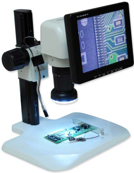
Ref. | Code: 50290001