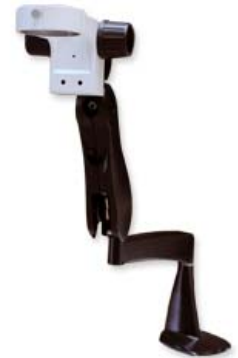
Ref. | Code: 90290006