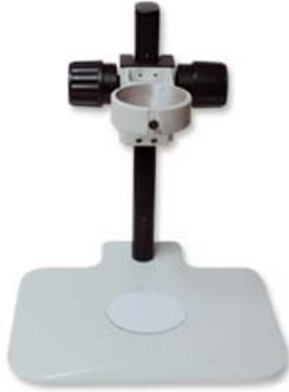
Ref. | Code: 90290002