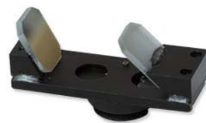
Ref. | Code: 90290001