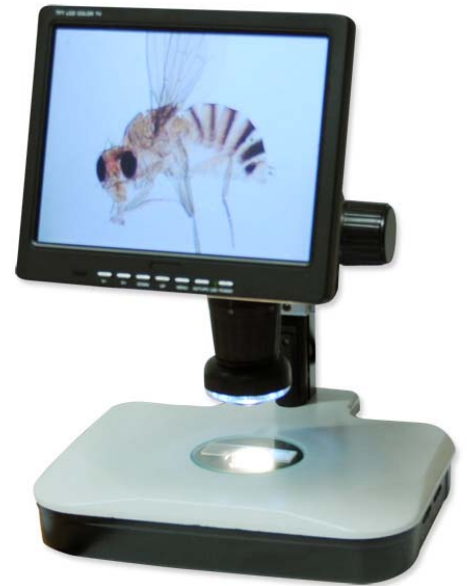
Ref. | Code: 50290002