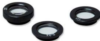
Ref. | Code: 9029010x